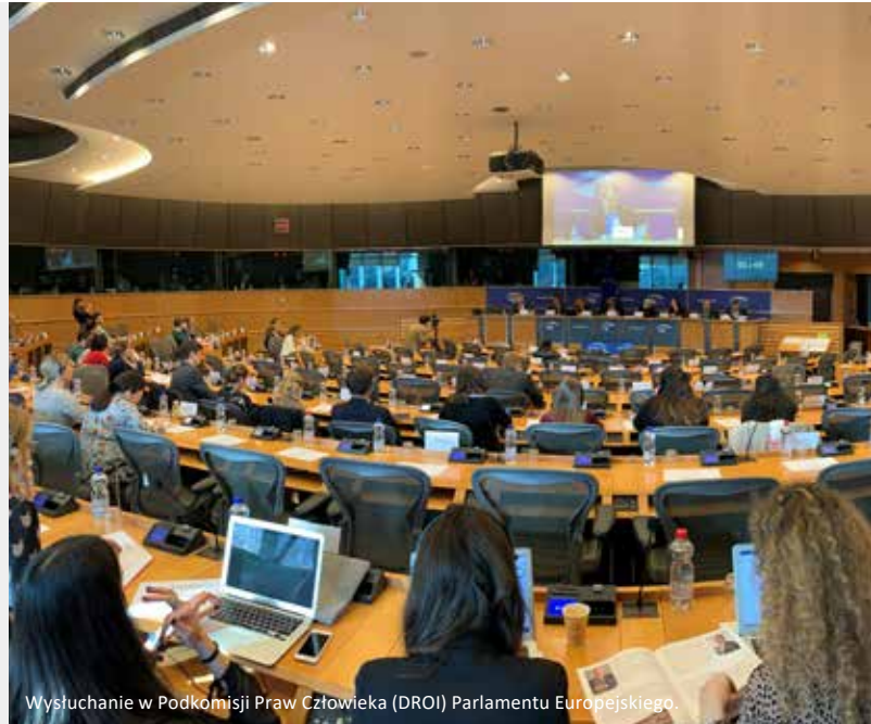
Wysłuchanie w Podkomisji Praw Człowieka (DROI) Parlamentu Europejskiego.