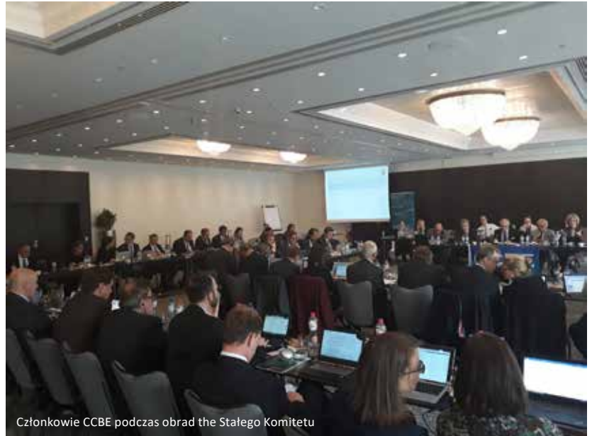
Członkowie CCBE podczas obrad the Stałego Komitetu

Podczas Stałego komitetu omówione zostały także najbliższe wydarzenia organizowane przez CCBE. W szczególności omówiono obchodzony 25 października Europejski Dzień Prawnika oraz Konferencję pt. Sztuczna inteligencja, ludzka sprawiedliwość , która odbędzie się 30 listopada w Lille, we Francji.