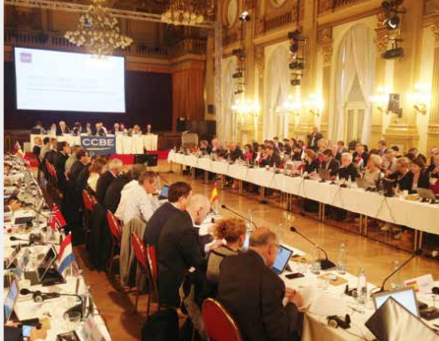
Sesja plenarna w Pradze