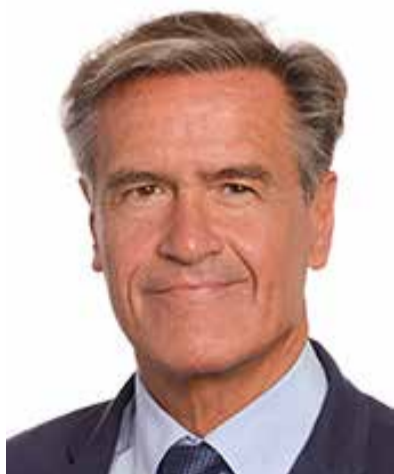
Juan Fernando López Aguilar, Przewodniczący Komisji Wolności Obywatelskich, Sprawiedliwości i Spraw Wewnętrznych Parlamentu Europejskiego