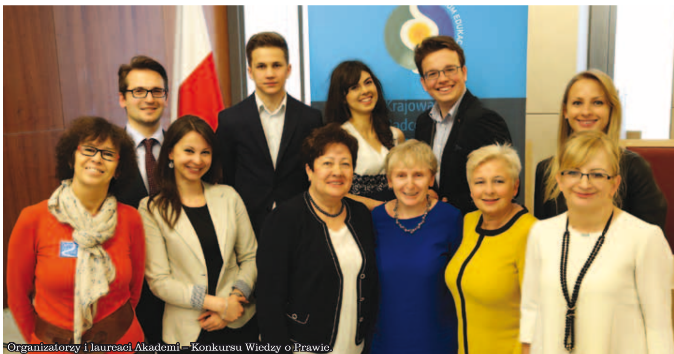
Organizatorzy i laureaci Akademii – Konkursu Wiedzy o Prawie.

15–16 MAJA W PRESTIŻOWYM GMACHU NACZELNEGO SĄDU ADMINISTRACYJNEGO W WARSZAWIE ODBYŁ SIĘ FINAŁ DRUGIEJ EDYCJI OGÓLNOPOLSKIEJ AKADEMII – KONKURSU WIEDZY O PRAWIE. ZAKOŃCZYŁ ON KILKUMIESIĘCZNE ZMAGANIA PRAWIE 1900 UCZNIÓW SZKÓŁ PODSTAWOWYCH I GIMNAZJALNYCH. MIMO NIEWĄTPLIWEGO SUKCESU TEGO KONKURSU JEGO DALSZY LOSY NIE SĄ PRZESĄDZONE.