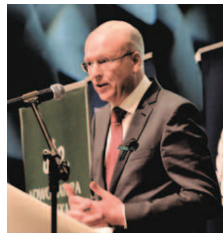
Koen Lenaerts, prezes Trybunału Sprawiedliwości Unii Europejskiej.

■ W pierwszym zagranicznym wystąpieniu prof. Koen Lenaerts, sędzia i prezes Trybunału Sprawiedliwości Unii Europejskiej, przypomniał uczestnikom o odpowiedzialności, jaka ciąży na przedstawicielach zawodów prawniczych, których nadrzędną misją jest poszukiwanie sprawiedliwości. Odniósł się także do zasad trójpodziału władzy w rozumieniu przedstawicieli zachodnich, europejskich demokracji. – Mamy tradycje konstytucyjne w krajach członkowskich Unii Europejskiej, w państwach założycielskich, tj. Francji, Niemczech czy krajach Beneluxu. To są mocne demokracje, osadzone poza władzą wykonawczą czy ustawodawczą, na filarze władzy sędziowskiej. Panuje u nas przekonanie, że niezależnie od dziedzictwa kulturowego czy wyznawanych wartości i religii należy w taki sposób chronić sędownictwo, by było one niezależne zarówno od sfery prywatnej, jak i publicznej. To oznacza, że większość polityczna ma konstytucyjny zakaz atakowania strony, która nie może bronić się w procesie politycznym. Dlatego wszystkie konstytucje członków UE