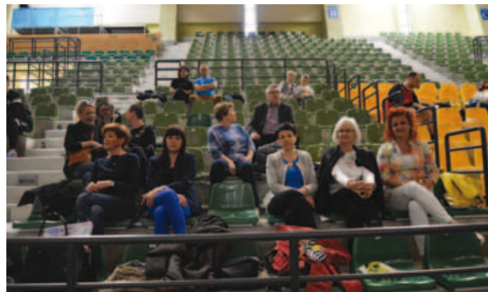
Zdjęcia OIRP Kielce

zły się reprezentacje z Kielc, Olsztyna, Krakowa, Rzeszowa i Opola, w grupie B – reprezentacje z Katowic, Częstochowy, Gdańska, Warszawy II i Białegostoku, a w skład silnej grupy C weszły drużyny z Wrocławia, Warszawy I, Bydgoszczy, Lublina i Łodzi. Symboliczne wykopanie piłki zainauguowało dwudniowe sportowe zmagania, które, jak zwykle, rozgrywane były pod okiem licencjonowanych sędziów piłkarskich. Co ciekawe, w tym gronie znalazł się podwójny pasjonat, który sędziuje zarówno na boisku, jak i sali sądowej. Od pierwszego gwizdka było jasne, że poziom rozrywek jest wysoki, a emocje i zaangażowanie z boiska udzielały się także kibicom, którzy dopingowali zawodników przy wsparciu profesjonalnej oprawy muzycznej (kto bywa, ten wie, której drużynie przyporządkowana jest chociażby muzyka z filmu „Janosik”). Ofiarna i ambitna gra w trakcie pierwszego dnia rozgrywek przełożyła się, niestety, na kilka kontuzji, ale – jak mówią Brytyjczycy: no pain, no gain .