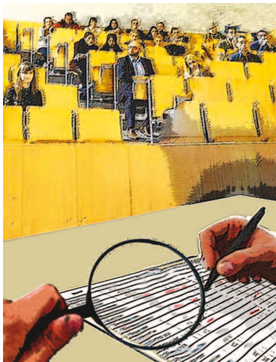
Rys. Kamili Strzyżewski

Kluczowa, zdaniem WSA, była jednak okoliczność związana z nieobecnościami aplikanta. W uzasadnieniu wyroku wskazano, że jeżeli – jak twierdzi skarżący – rzeczywiście doszło do zmiany harmonogramu zajęć w czasie trwającej aplikacji, nie może to – zdaniem sądu – wywoływać negatywnych skutków wobec aplikantów, którzy – pracując zawodowo – zobowiązani są w wyprzedzeniem planować rozkład pracy i zajęć aplikacyjnych. Z tych przyczyn nie można było wyciągać w stosunku do aplikanta tak daleko idących konsekwencji, jak skreślenie go z listy.