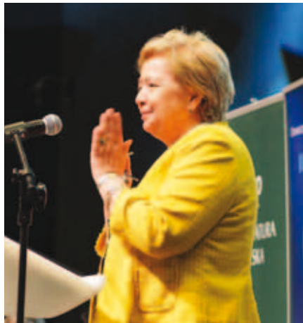
Małgorzata Gersdorf, Pierwszy Prezes Sądu Najwyższego.

powierzają sędziom zadania jako władzy niezawisłej, by samodzielnie realizowały swoje zadania. Trzeba podkreślić, że idea sprawiedliwości jest ściśle powiązana z ochroną jednostkową praw obywatelskich i ochroną demokracji. A demokracje są tak mocne, jak ochrona praw jednostki, praw obywatelskich, które gwarantuje. Im bardziej niezawisli sędziowie, tym skuteczniejsza ochrona praw jednostki, a co za tym idzie – tym silniejsza demokracja. Niezależne i niezawisłe sądownictwo jest warunkiem przetrwania Unii Europejskiej. Sędziowie muszą być w Europie niezależni, bo czasem orzekają przeciw własnym krajom, ale z korzyścią dla obywateli ( http://bit.ly/tsue ).