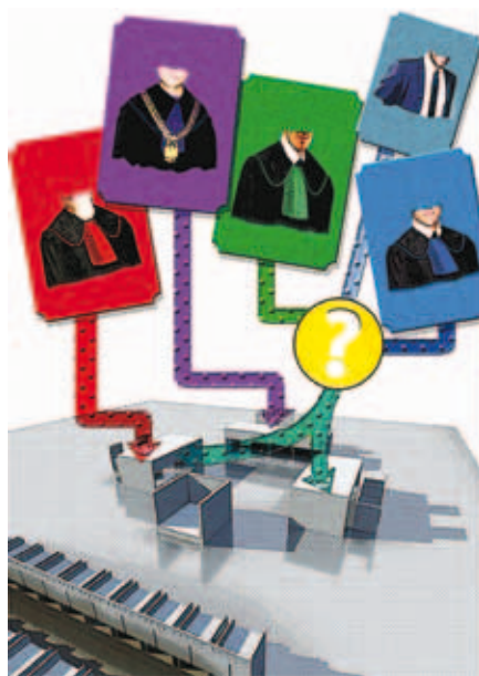
Rys. Kamil Strzyżewski

Poza wymienionymi na wstępie uprawnieniami aplikant radcowski może także sporządzać i podpisywać pisma procesowe związane z występowaniem radcy prawnego przed sądami, organami ścigania i organami państwowymi, samorządowymi i innymi instytucjami – z wyraźnego upoważnienia rad-