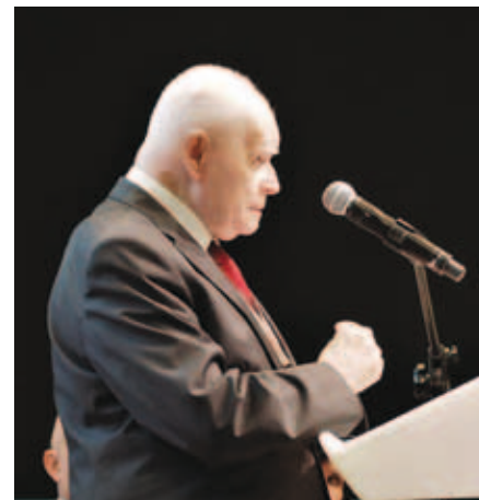
Adam Strzembosz, były Pierwszy Prezes Sądu Najwyższego.

nym odpowiedzi na pytanie: „po co ludziom sądy?”. Artysta wspominał swego ojca, który w czasach PRL-u sprawował urząd prokuratora i tylko dzięki umiłowaniu wolności i niezależności nie zrobił wielkiej kariery w dawnym systemie. – Jak powiedział Andrzej Wajda: są ludzie, którym wolność do życia jest bezwzględnie potrzebna. A innym nie. Tak ludzie są skonstruowani. Ja jestem dumny z tego, że