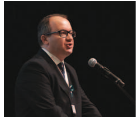
Adam Bodnar, rzecznik praw obywatelskich.

– Widzimy, że politycy bardzo często uzbierają się w niszczącą retorykę podziału my