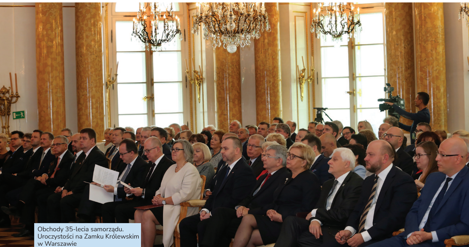
Obchody 35-lecia samorządu. Uroczystości na Zamku Królewskim w Warszawie