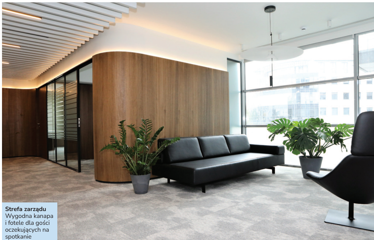
Strefa zarządu Wygodna kanapa i fotele dla gości oczekujących na spotkanie