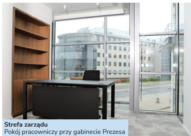
Strefa zarządu Pokój pracowniczy przy gabinecie Prezesa